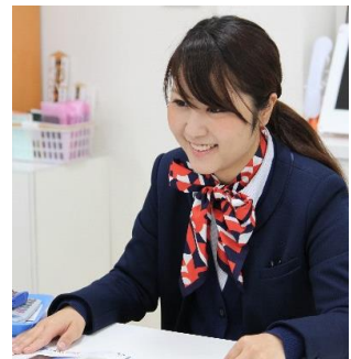
未経験者も全員でフォローします！

【お客様に愛される店舗】を目指しているので、「あなたに接客してもらえて良かった！」とお言葉を頂いた時は、嬉しさと同時にやりがいを感じます。定期的に社員交流会が開かれているので、同じ立場の者同士、仕事の悩みや役立つ情報などを共有できる貴重な場があり毎回とても励みになります。