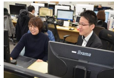
【打ち合わせしながら業務中】

実は、IT企業における就職活動においてパソコンのスキルは、さほど重要なことではありません。弊社は、社内研修制度があり、未経験でも基本から学ぶことができます。また、先輩社員やチームで仕事をしていく中で、自然とスキルを身につけることができます。それよりも、「まずは、やってみる」という気持ちと行動力を大切にしています。仕事をしていく中で、失敗を恐れず、さまざまな経験を積むことが成長につながると考えているからです。例えば、失敗することがあったとしても、先輩社員が必ずフォローします。弊社と一緒に楽しく・面白い仕事をしましょう！