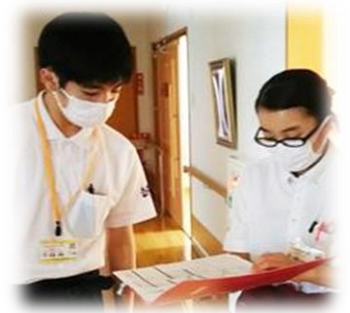
【新入職員と先輩職員】

介護未経験で入社し、不安なことばかりでしたが、ブラザーシスター制度における先輩職員のサポートのおかげで、今では毎日楽しく介護を勉強させてもらっています。