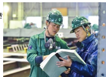
【チームで協力しながら仕事をします】